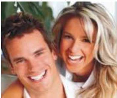
Ein strahlendes Lächeln mit makellos schönen Zähnen

■ Dann werden Mund, Zähne und Zahnfleisch untersucht. Die Zahnbeläge werden angefärbt, um sie besser sichtbar zu machen und es wird die Tiefe der Zahnfleischtaschen gemessen.