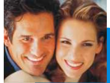
Schöne Zähne, gesundes Zahnfleisch und frischer Atem: Ein gutes Gefühl!

Warum immer mehr Menschen Ihre Zähne regelmäßig von Profis reinigen lassen!