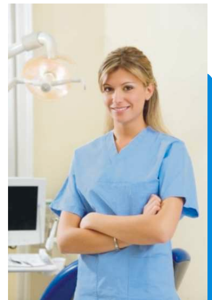
Gut ausgebildet, schonend, sanft und gründlich: Die Prophylaxe-Fachkraft

Bitte beachten Sie, dass die gesetzlichen Krankenkassen nicht für die Professionelle Zahnreinigung aufkommen. Private Versicherer erstatten in der Regel die Kosten. Viele gesetzliche und private Krankenversicherer haben Bonusprogramme, mit denen Sie die regelmäßige Teilnahme ihrer Versicherten an Prophylaxe-Maßnahmen fördern und belohnen. Erkundigen Sie sich darüber bitte bei Ihrer Versicherung! Vertrauen Sie Ihre Zahngesundheit Profis an!